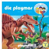
Folge 3 Die Dinos kommen