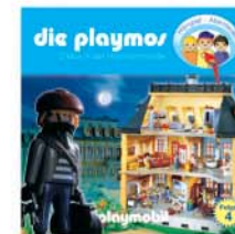
Folge 4 Chaos in der Herrmannstraße