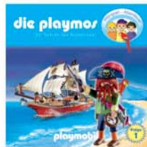
Folge 1 Der Schatz der Teufelsinsel

Tobi spielt mit seinen PLAYMOBIL-Welten im Kinderzimmer. Seine drei Lieblingsfiguren Sam, Emil und Liv dürfen dabei nicht fehlen. Immer wenn er das Zimmer verlässt, passiert jedoch etwas sehr Merkwürdiges: Die Figuren werden lebendig und die Playmos erleben aufregende und lustige Abenteuer auf dem Piratenschiff, auf der Ritterburg, mit den Dinos und im Puppenhaus.